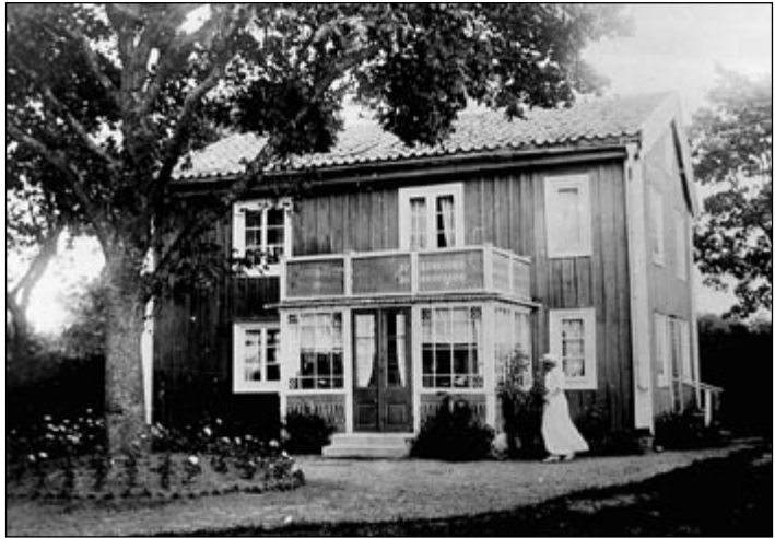
Undantagshuset till Berga 3, tidigare Westerlundska stället.