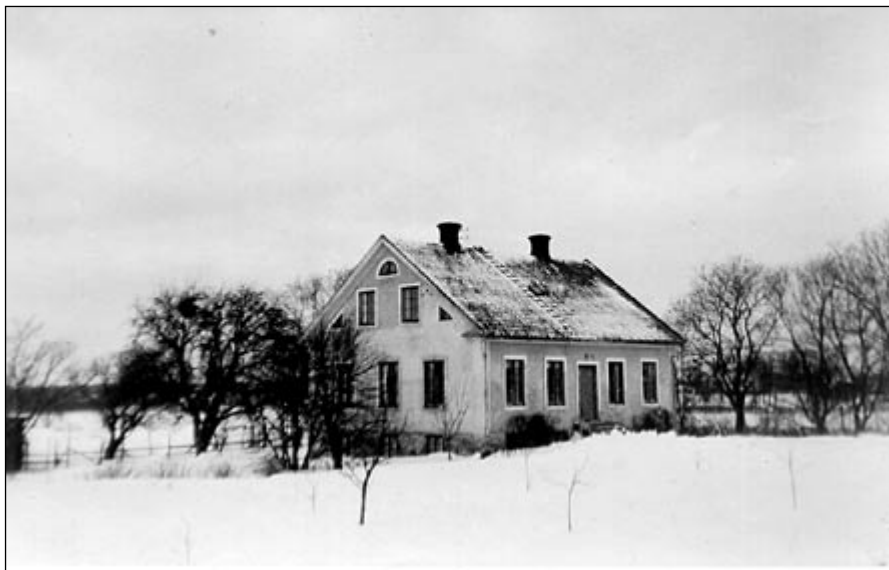
Gård nr 5 Bolagsgården