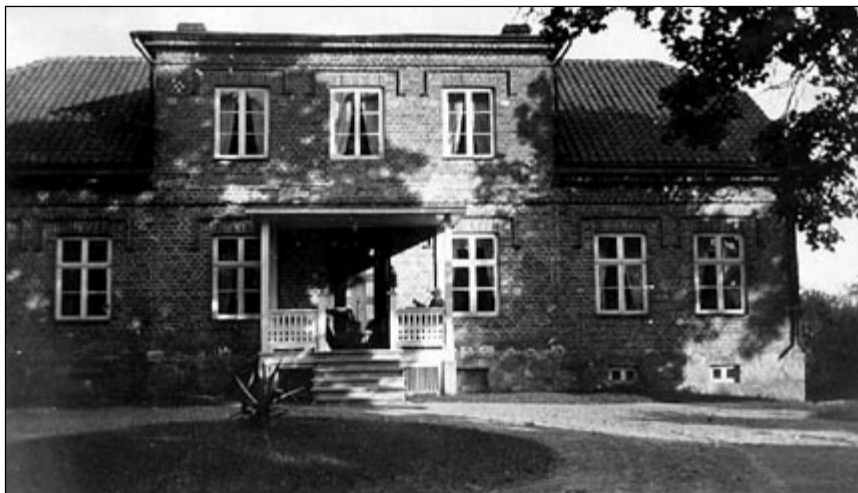
Berga Bruksgårds boningshus

trääd, som planterades längs riksvägen vid hans egen gård.